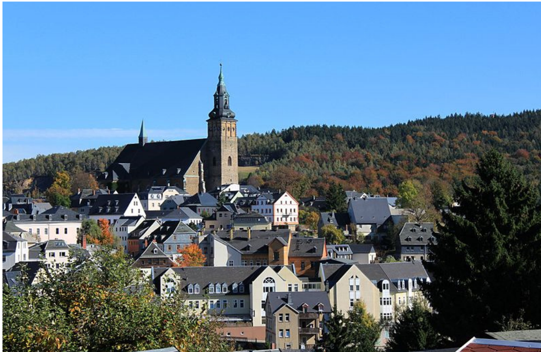
Schneeberg im Erzgebirge mit St. Wolfgangskirche